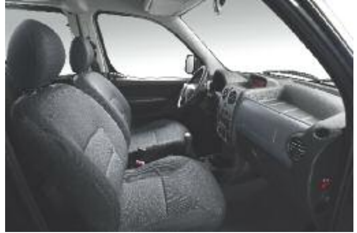
PARTNER PATAGÓNICA VTC Vendome + Omni Serge