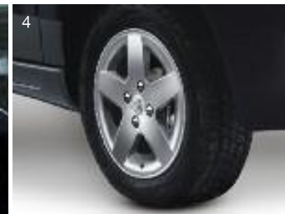
1. Interior. 2. Grillas de protección faros delanteros. 3. Grillas de protección de faros traseros. 4. Llantas de aluminio Mónaco 15".