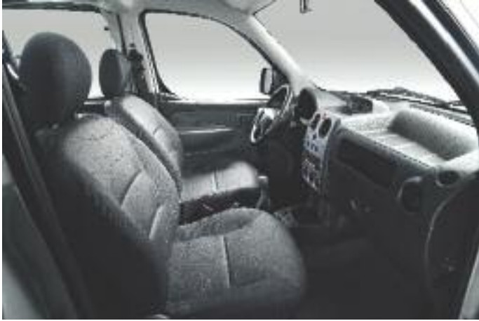
PARTNER PATAGÓNICA Arco + Omni Serge