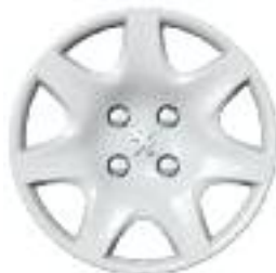
Embellecedor Pacaya 15''