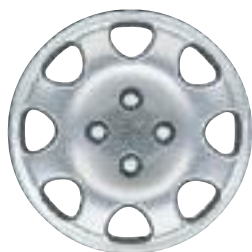
Embellecedor Cuba 14''