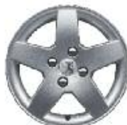
Llantas de aluminio Mónaco 15''