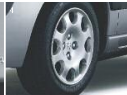
1. Interiores. 2. Faros delanteros de vidrio liso. 3. Faros traseros. 4. Ruedas de 14" con embellecedor.