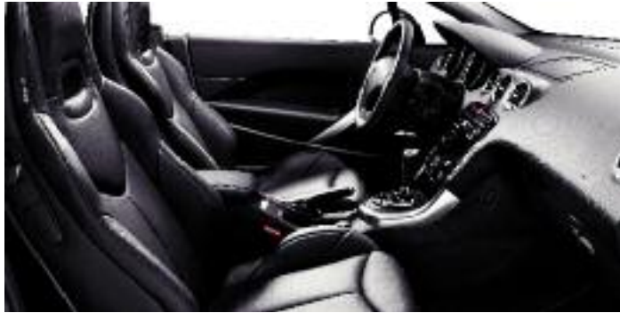
CUERO NEGRO CLAUDIA MISTRAL