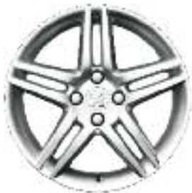
Llantas de aluminio STROMBOLI 17"