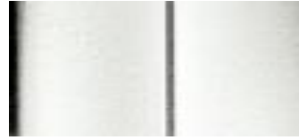
BLANCO NACRÉ (TRICAPA)