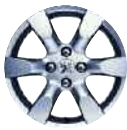
Equinoxe 16" XT Premium y XS Premium