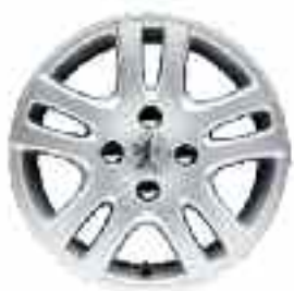
Cotya 15" XS