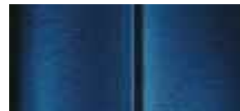
AZUL DE CHINA