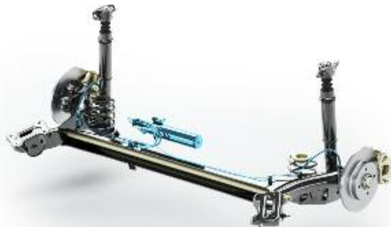
Dynamic Rolling Control

El Dynamic Rolling Control® aumenta el dinamismo del comportamiento rutero, al reducir el balanceo, sin perjudicar el confort. Este sistema de acoplamiento hidráulico de los amortiguadores traseros permite optimizar el compromiso entre el confort y el comportamiento en curvas.