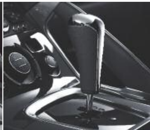
Caja automática secuencial Tiptronic System Porsche®