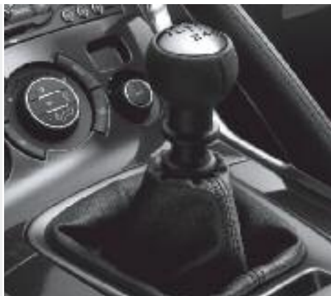
Caja manual de 6 velocidades

Pero lo más impresionante es que, gracias a toda la tecnología aplicada, permiten que el 3008 brinde consumos propios de autos de segmentos inferiores y lo hacen amigable con el medio ambiente.