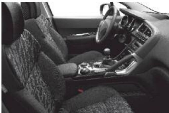
Tapizado textil Ombrage en ambiente Tramontane