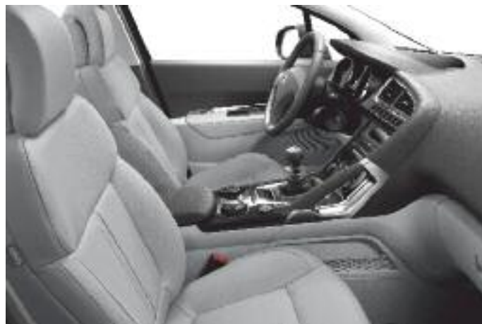
Cuero Claudia en Ambiente Guérande

La información y las ilustraciones que figuran en este folleto se basan en las características técnicas vigentes en el momento de la impresión del presente documento (Enero 2011). El equipamiento presentado en los vehículos fotografiados es de serie u opcional según las versiones. En el marco de una política de mejora constante del producto, Peugeot puede modificar sin preaviso las características técnicas, el equipamiento, las opciones y los tonos. De esta manera, este folleto constituye una información de carácter general y no un documento contractual. Para toda información complementaria, le rogamos dirigirse a su concesionario.