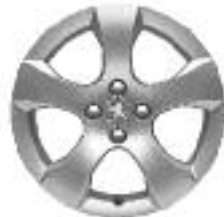
Llantas de aleación Savara 17"