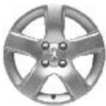
Llantas de aleación Isara 16"